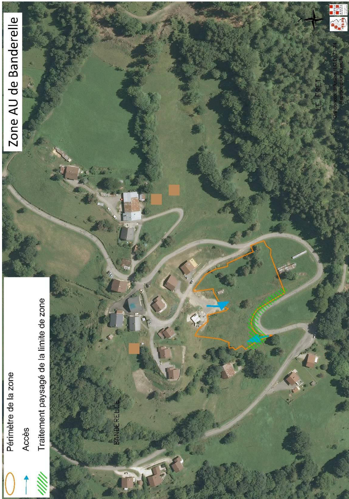
Figure 4 : Orientation d'aménagement et de programmation de Banderelle