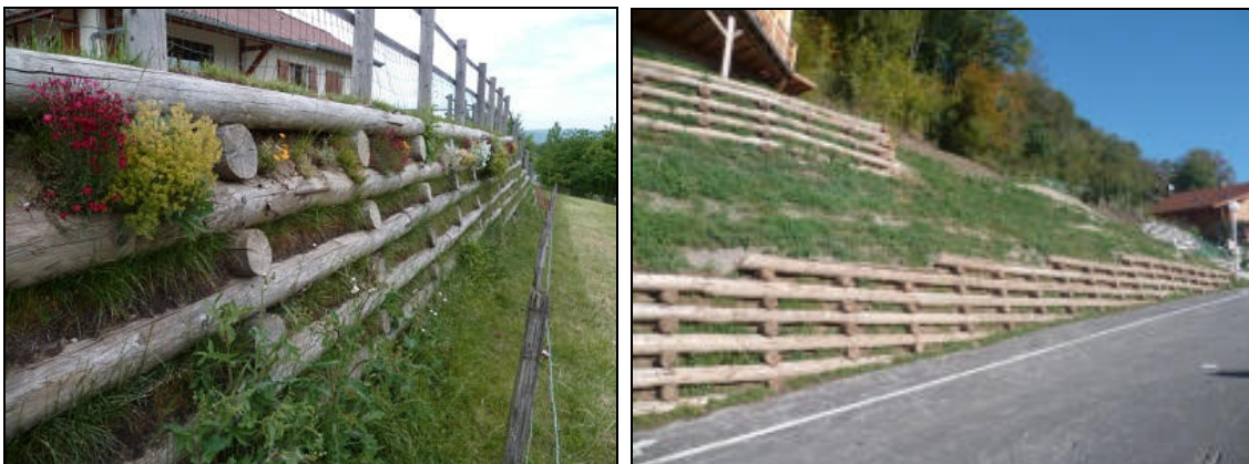
Figure 2 : Exemple de talus de soutènement en bois