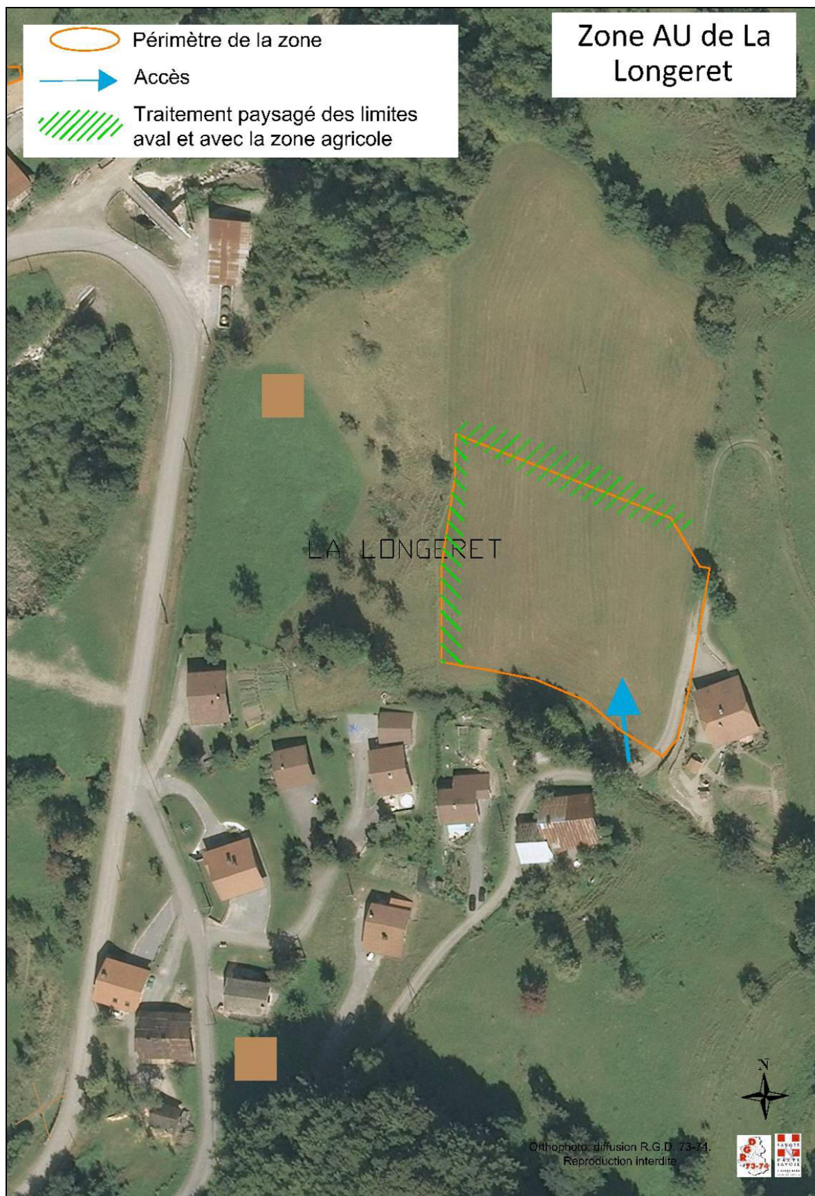
Figure 3 : Orientation d'aménagement et de programmation de La Longeret